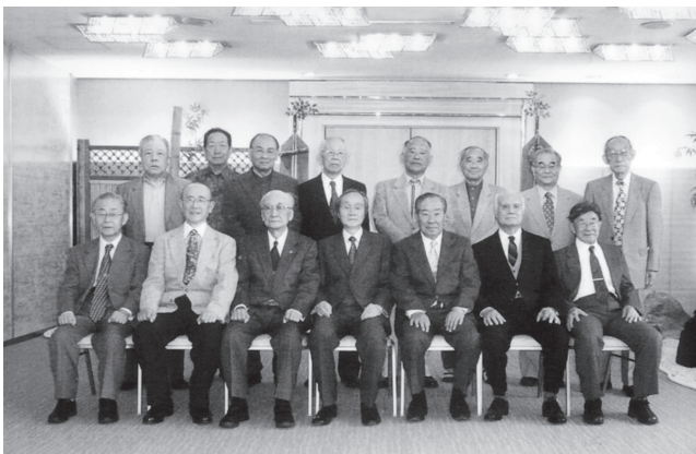
2012年5月25日 電信会・懇親会 於:銀座ラフィナート

アンサンブル・ステラ合唱団はシニアコーラス第16回TOKYOフェスティバルで準優勝の栄に浴しまし